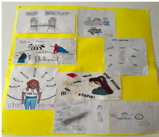
Foto nga veprimtaritë