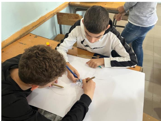
FOTO TË VEPRIMTARIVE