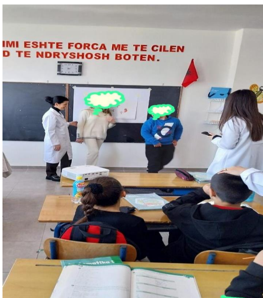
FOTO TË VEPRIMTARIVE

Si përfundim themi se projekti i realizuar pati sukses dhe është një shembull për tu ndjekur edhe nga shkollat e tjera. Puna me fëmijët me aftësi të kufizuara na ka bërë që ne që punojmë drejtpërsëdrejti me këto fëmijë të na ndryshojnë pritshmëritë e jetës tonë.