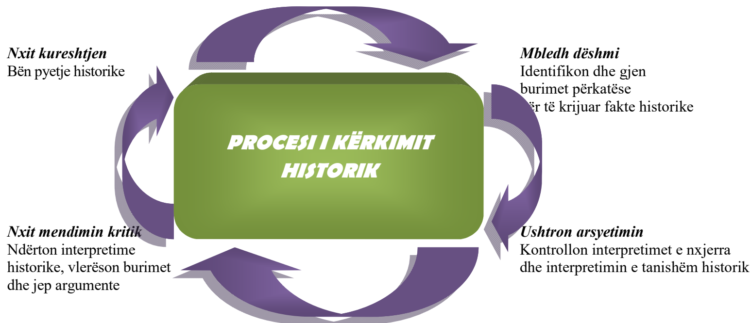
Figura 1. Procesi i kërkimit historik

Përdorimi i kërkimit historik duhet të jetë në qendër të mëimit të historisë, dhe mësuesit duhet t'i krijojnë mundësinë nxënësit, për të mësuar aftësitë e nevojshme përmes praktikës dhe angazhimit në kërkimin historik. Përdorimi i pyetjeve në çdo njësi mësimore siguron një pikë kontakti për nxënësit, për të kërkuar, sistemuar dhe analizuar informacion, në përgjigje të çështjeve që hulumtohen në programin mësimor. Qasja kërkimore, kur zbatohet në mënyrë efektive, zhvillon cilësitë historike dhe aftëson nxënësit të jenë të pavarur, krijues dhe mendimtarë kritik. Ajo nxit demonstrimin e kompetencave historike dhe kompetencave kyçe të nxënësve. Tabela e mëposhtme paraqet një përforcim të qasjes kërkimore, për të ndihmuar mësuesit në përdorimin e kësaj qasje.