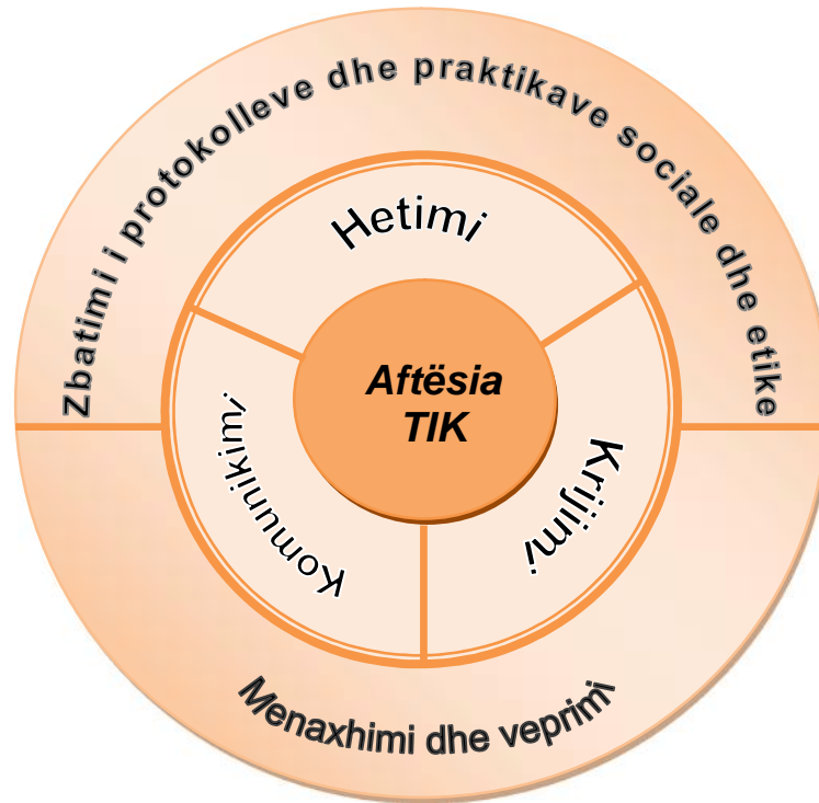
Diagrama e mëposhtme paraqet organizimin e kompetencave të fushës