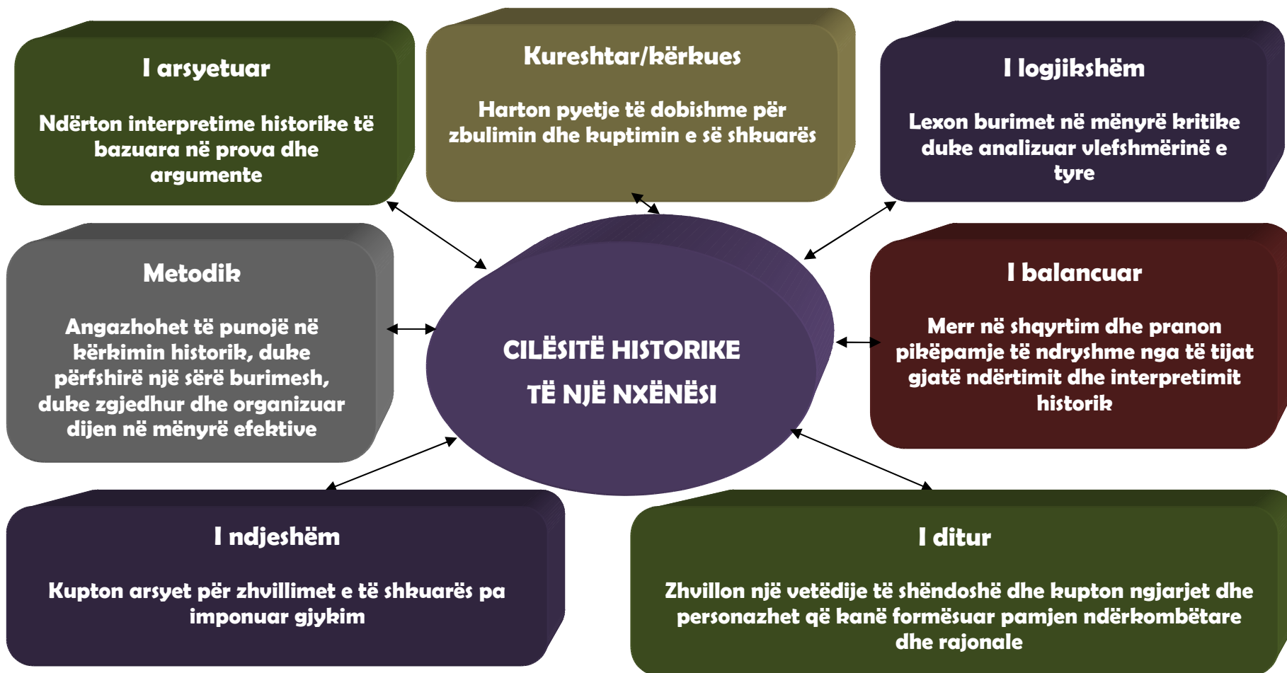
Diagrami. 5 Cilësitë historike të nxënësit