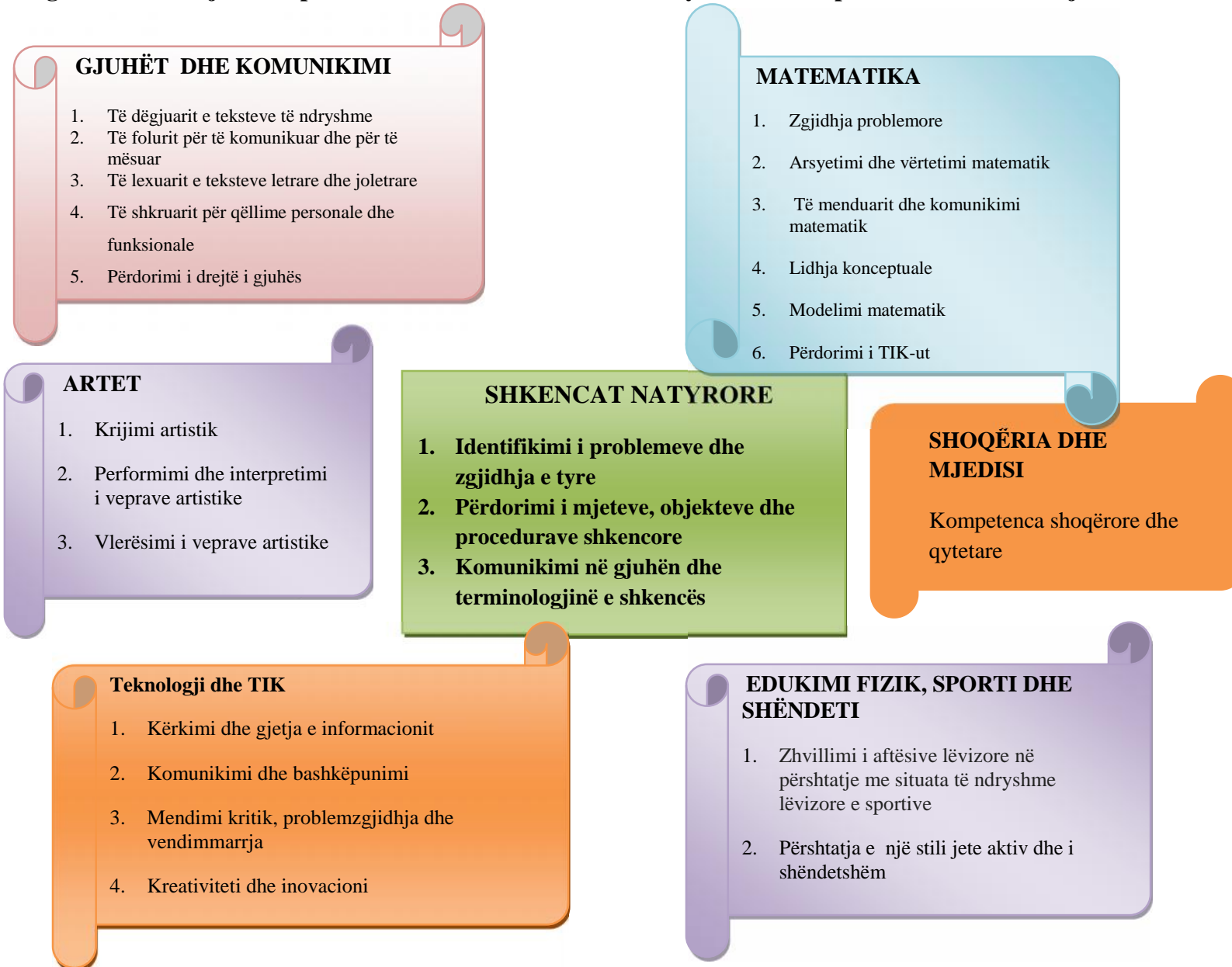
Diagrami 2 Lidhja e kompetencave të fushës së shkencave natyrore me kompetencat e fushave të tjera