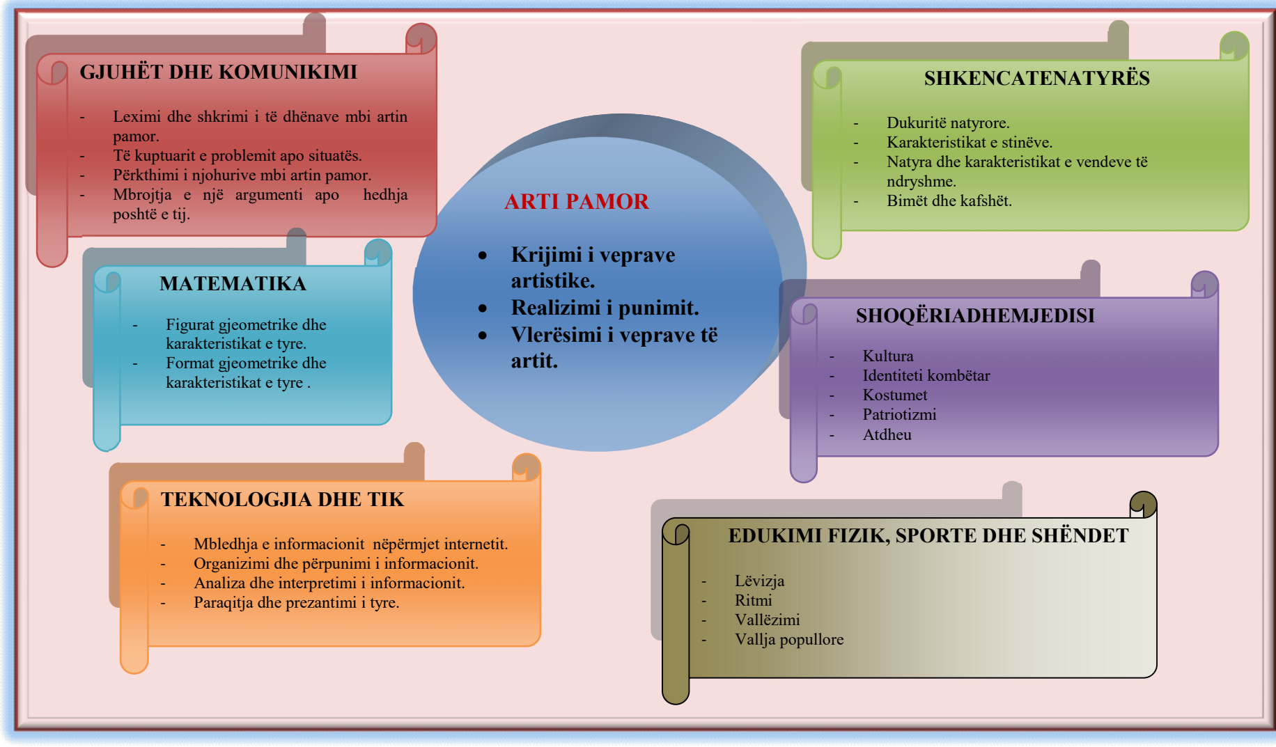
Digrama 3: Lidhja ndërmjet artit pamor dhe fushave të tjera.