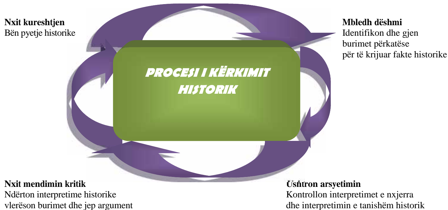
Figura 1. Procesi i kërkimit historik