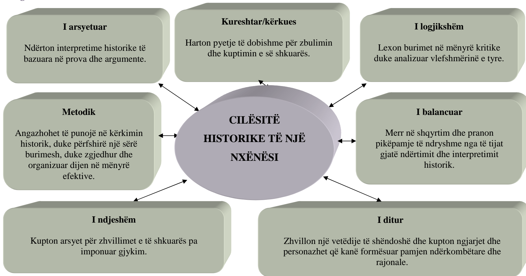
Diagrami 5. Cilësitë historike të nxënësit

Lënda e historisë i ndihmon nxënësit që të bëhen të ditur, të logjikshëm, kureshtarë, të balancuar, të ndjeshëm, dhe individë të aftë për të dhënë argumente dhe për të marrë vendime të arsyetuara mirë.