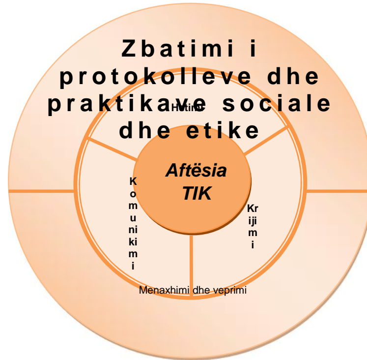
Diagrama e mëposhtme paraqet organizimin e kompetencave të fushës