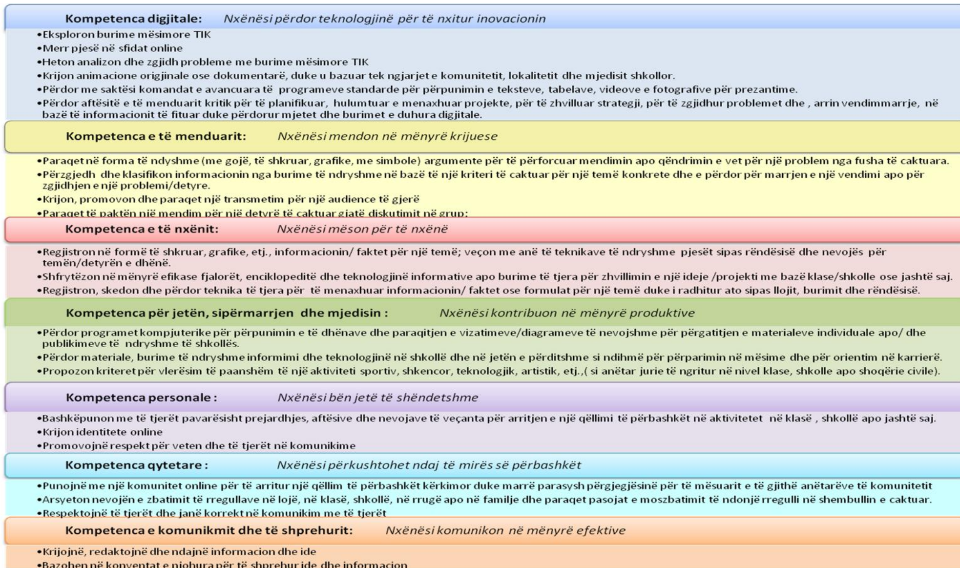
Diagrama 2 Rezultatet kryesore të nxënimit sipas kompetencave kyçe që realizohen nëpërmjet lëndës së TIK-ut për shkallën e pestë.