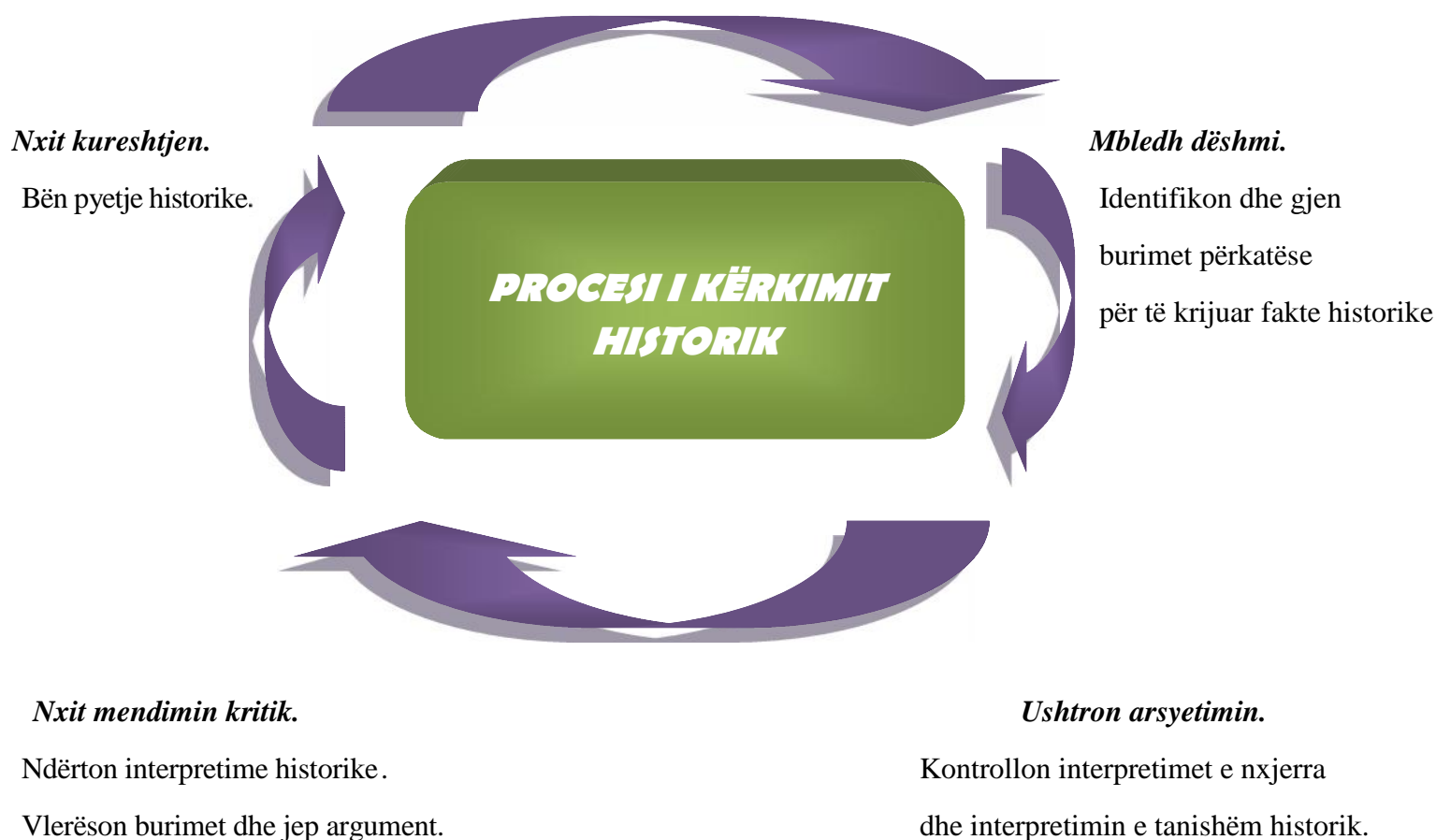
Figura 1. Procesi i kërkimit historik

Përdorimi i kërkimit historik u paraqet nxënësve një mënyrë për të bërë hulumtime, për të organizuar dhe për të shpjeguar ngjarjet që kanë ndodhur. Kërkimi historik është procesi i "të bërit histori". Ai është një proces ciklik (figura. 1), që fillon me shkrimin e pyetjeve historike, pasohet nga gjetja dhe analiza e burimeve historike për të krijuar fakte dhe dëshmi historike. Dëshmia historike përdoret më pas për të ndërtuar interpretimet historike që kërkojnë t'iu përgjigjen pyetjeve historike.