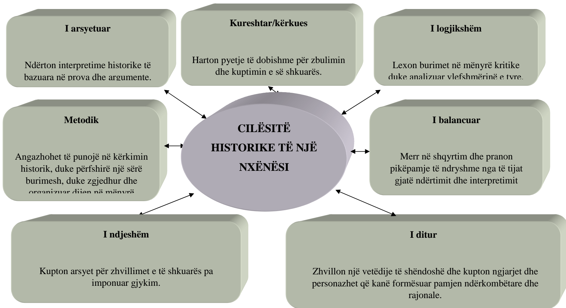
Diagrami 5. Cilësitë historike të nxënësit