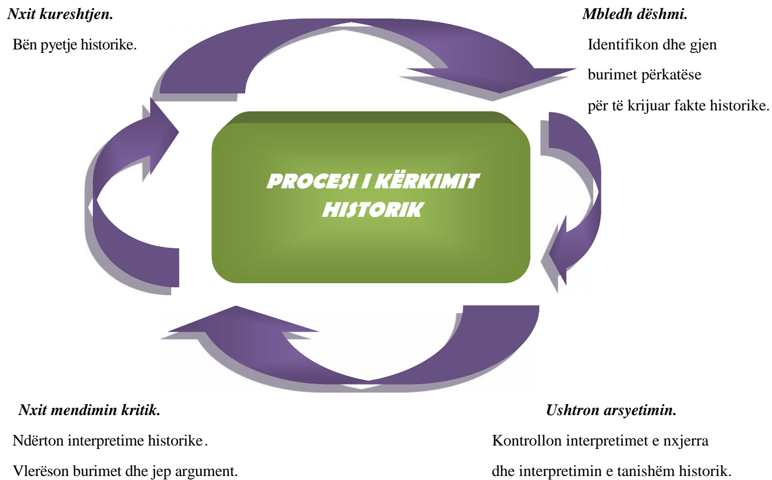
Figura 1. Procesi i kërkimit historik