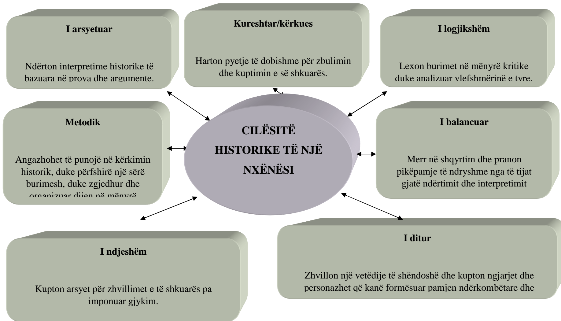
Diagrami 5. Cilësitë historike të nxënësit