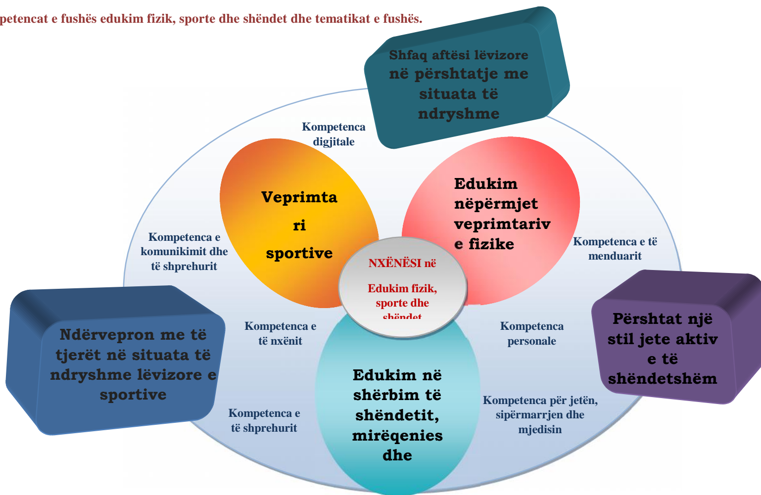
Digrama 4: Kompetencat e fushës edukim fizik, sporte dhe shëndet dhe tematikat e fushës.

Bazuar në këtë kurrikul, fusha/ lënda “Edukim fizik, sporte dhe shëndet” synon të përmbushë 3 kompetencat e fushës/lëndës, të cilat lidhen me kompetencat kyçe që një nxënës duhet të zotërojë gjatë jetës së tij dhe që arrihen nëpërmjet 3 tematikave kryesore.