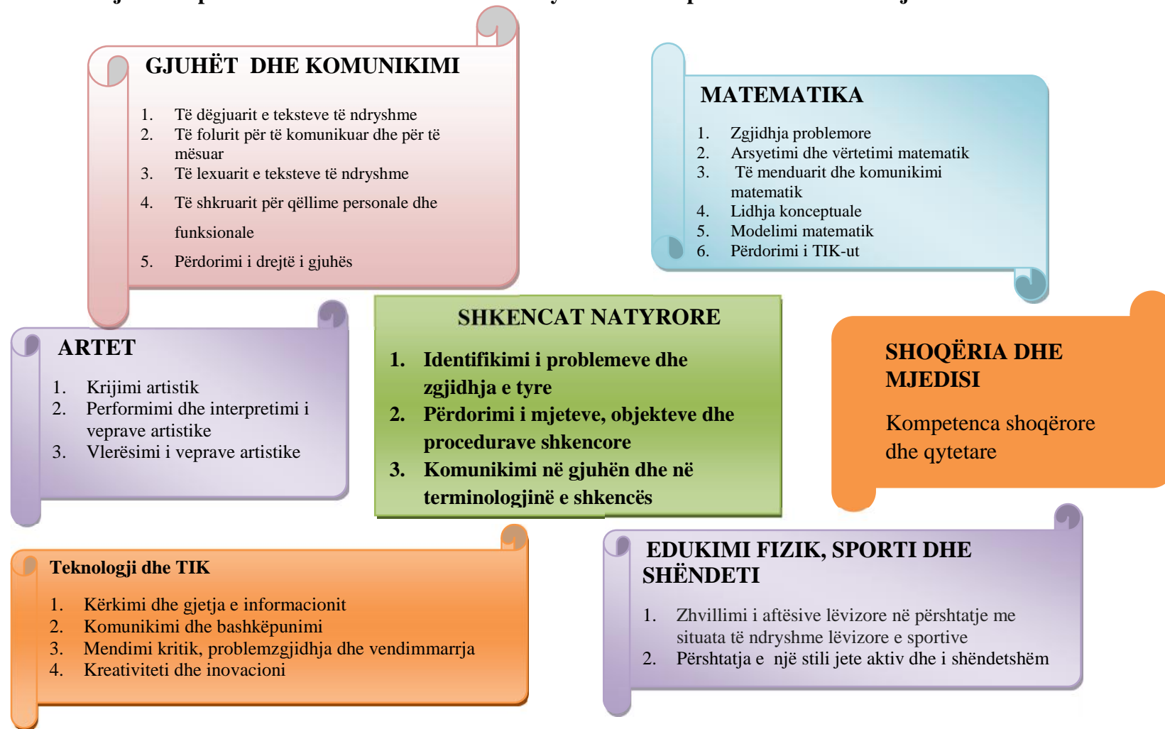
Diagrami 2. Lidhja e kompetencave të fushës së shkencave natyrore me kompetencat e fushave të tjera

SHËNIM: Zbatuesit e programit janë të lirë t'i kombinojnë dhe t'i rendisin njohuritë dhe rezultatet e të nxënit brenda tematikës dhe ndërmjet tematikave, sipas planifikimit të tyre. E rëndësishme është që të mundësohet arritja e të gjithë rezultateve të të nxënit nga nxënësit.