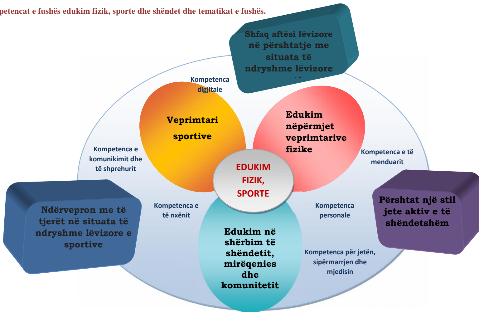
Diagrami4: Kompetencat e fushës edukim fizik, sporte dhe shëndet dhe tematikat e fushës.

Bazuar në këtë kurrikul, fusha/ lënda “Edukim fizik, sporte dhe shëndet” synon të përmbushë 3 kompetencat e fushës/lëndës, të cilat lidhen me kompetencat kyçe që një nxënës duhet të zotërojë gjatë jetës së tij dhe që arrihen nëpërmjet 3 tematikave kryesore.