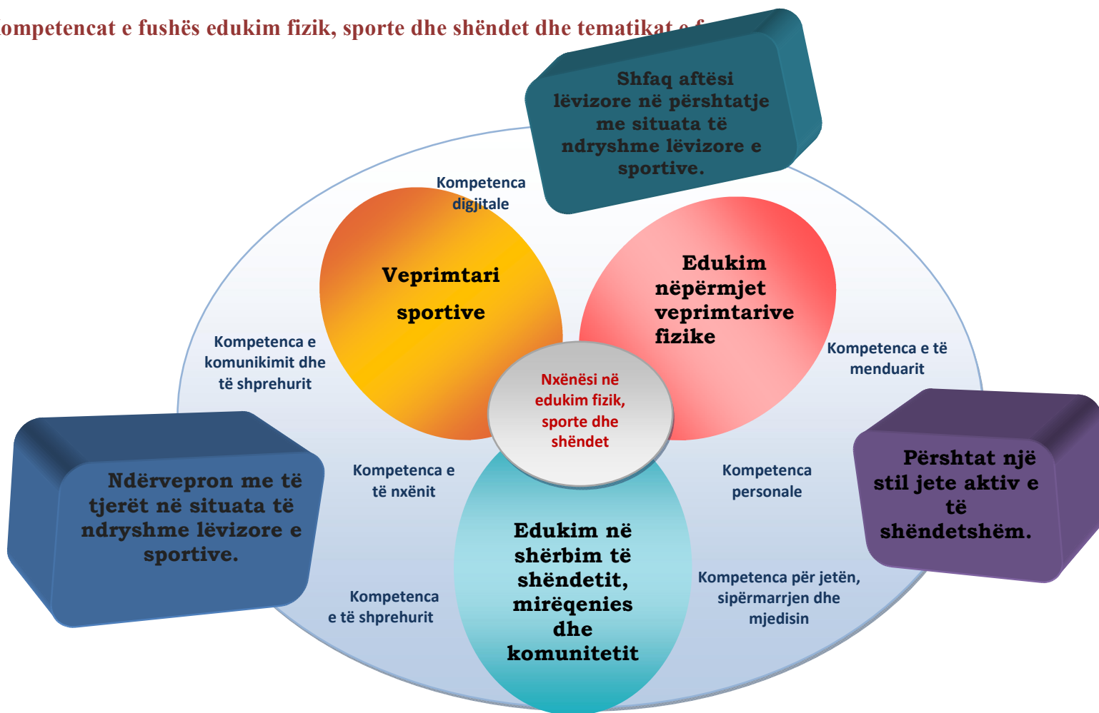
Diagrami 4: Kompetencat e fushës edukim fizik, sporte dhe shëndet dhe tematikat e fushës

Bazuar në këtë kurrikul, fusha/ lënda “Edukim fizik, sporte dhe shëndet” synon të përmbushë 3 kompetencat e fushës/lëndës, të cilat lidhen me kompetencat kyçe që një nxënës duhet të zotërojë gjatë jetës së tij dhe që arrihen nëpërmjet 3 tematikave kryesore.